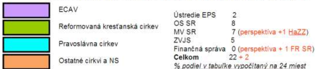
Pomerné rozdelenie vytvorených miest duchovných Ústredia EPS v OS SR a OZ SR jednotlivým RCNS, podľa čl. 28 Štatútu Ústredia